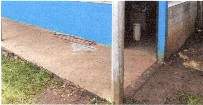
Foto 3: Se observa que la losa de patio está en mal estado, por lo que se solicita la reparación y culminación del mismo.