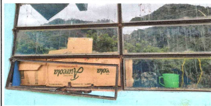
Foto 5: Se observa que las ventanas están deterioradas, por lo que se solicita el cambio de las mismas.