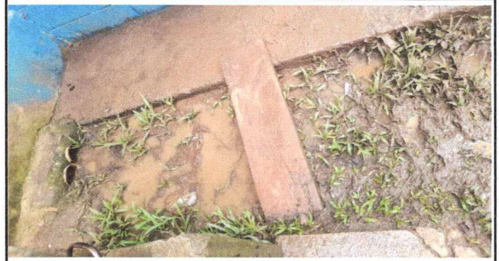
Foto 2: Se observa el mal estado de las cunetas, se solicita la reparación de las cunetas.