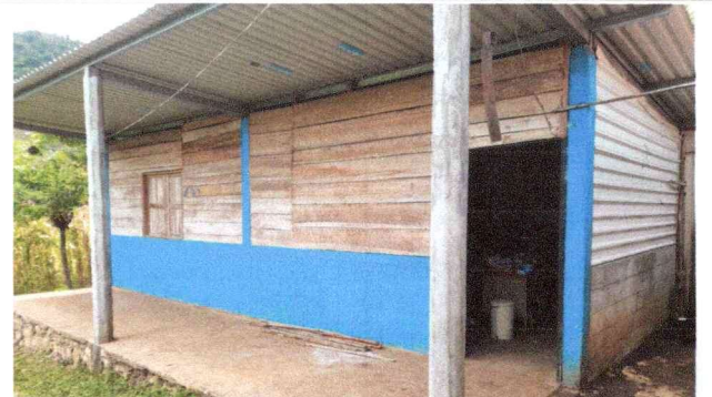
Foto 6: Se observa que el aula No. 3 tiene las paredes en mal estado por lo que se solicita la reparación de las paredes y sustitución de ventanas.

Observación: Si es necesario se pueden agregar hojas adicionales y actualizar el número de hojas.