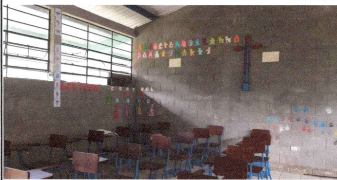
Foto 1: Se observa que la pintura y el repello de las paredes están deterioradas, se solicita el repello y pintura para las paredes del centro educativo.